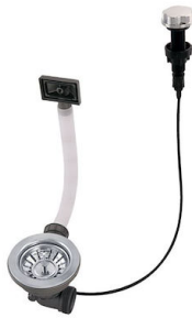
Piletta automatica 8407 000