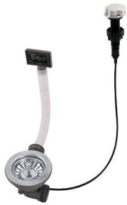
Piletta automatica 8407 100