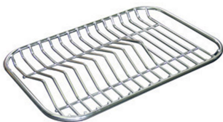
Griglia portapiatti inox 8100 280