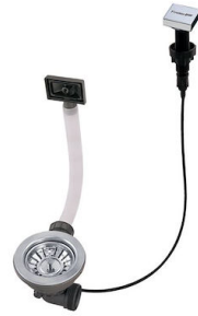
Piletta automatica LIRA 8407 102