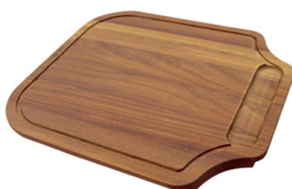
Tagliere in legno Iroko 8655 000