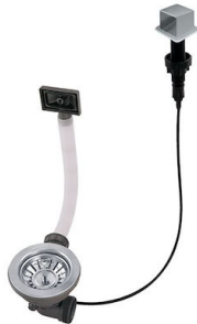
Piletta automatica LIRA 8407 103