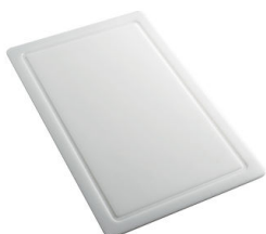
Tagliere in HPDE 8657 001